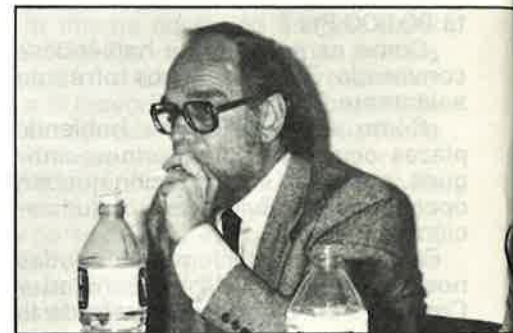
Asistentes a la mesa redonda "