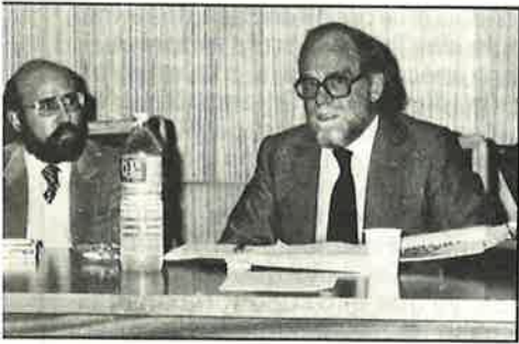
... en la Conferencia de los comunistas