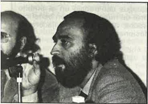
...dos políticos y psicólogos"

Desde el número 3 de Papeles (pp. 35 y sig.) no habíamos vuelto a dar cuenta de cómo iban nuestros estatutos cubriendo etapas hacia su plena vigencia. Desde entonces diversos incidentes procesales han sido resueltos; algunos sin mayor trascendencia, por referirse a aspectos formales de escasa o nula implicación profesional, aunque sí la tengan legal: así, los que tuvieron que ver con la compatibilidad entre el redactado de nuestro proyecto de estatutos y la Ley de Procedimiento Administrativo.