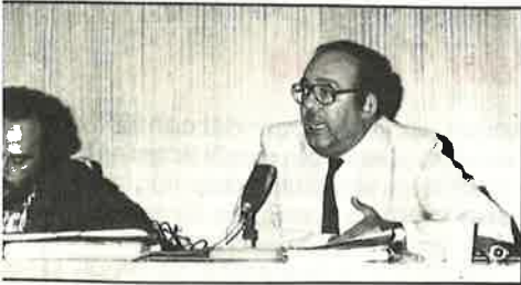
...ndez en la Conferencia de ese partido