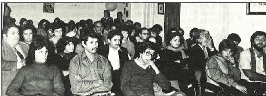
Asistentes a la mesa redonda "Partidos políticos y psicólogos"