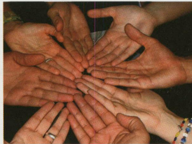
La información de este tríptico puede estar sujeta a modificaciones