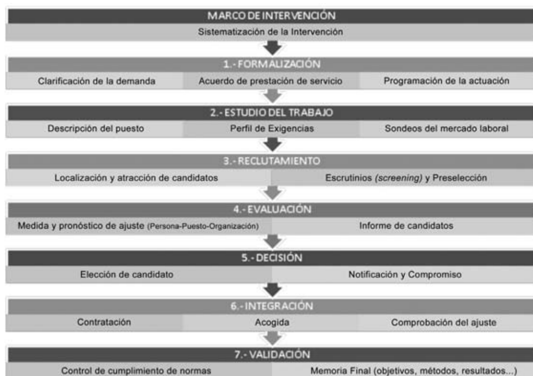
Gráfico 2.- Diagrama de hitos a alcanzar en los procesos de Reclutamiento y Selección

En cada una de ellas se especifican los productos derivados de las mismas. A continuación se aborda, en detalle, cada una de ellas