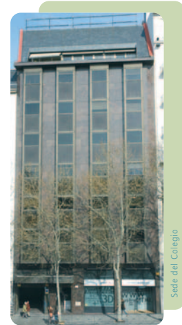
Sede del Colegio

Más información en el 915419999 ext. 620, en la dirección de correo electrónico: formacion@cop.es o en la página web: www.copmadrid.org , en la que, en el apartado de formación se podrá encontrar el programa completo de cada actividad formativa.