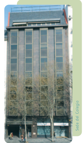
Sede del Colegio

Más información en el 915419999 ext. 620, en la dirección de correo electrónico: formacion@cop.es o en la página web: www.copmadrid.org , en la que, en el apartado de formación se podrá encontrar el programa completo de cada actividad formativa.