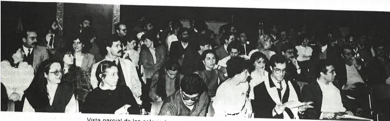
Vista parcial de los colegiados que asistieron a la Junta General Ordinaria